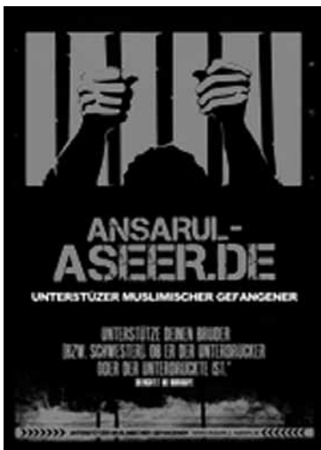
Abb. 2: Logo der Gefangenenhilfe „Ansarul Aseer“

Die dschihadistische Szene reagierte mit der Gründung des Projekts auf vermehrte Verfahren und Verurteilungen gegen ihre Klientel, die unter anderem durch die Aufnahme neuer Anti-Terror-Paragrafen im Strafgesetzbuch ermöglicht wurden, die am 28. Mai 2009 vom Deutschen Bundestag beschlossen worden waren und am 4. August desselben Jahres in Kraft traten (vgl. Deutscher Bundestag 2012a). 29 Auf eine Kleine Anfrage antwortete die Bundesregierung, dass seit Inkrafttreten der entsprechenden Paragrafen 14 Ermittlungs-